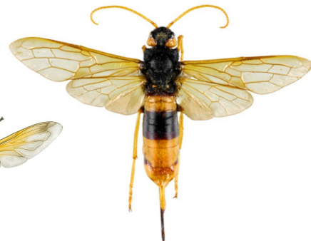
Cacynen y coed ( Urocerus gigas )