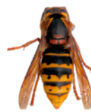
Gwenynen feirch ganolwedd ( Dolichovespula media )