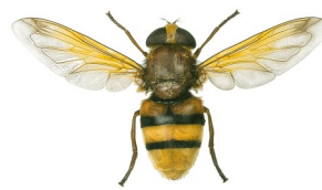
Pry hofran sy'n dynwared cacynen ( Volucella zonaria )