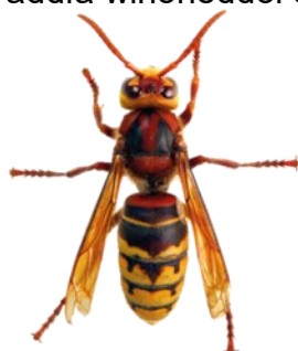
Cacynen Ewrop ( Vespa crabro )