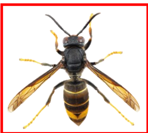
Cacynen felyngoes ( Vespa velutina )

Mae ychydig yn llai na chacynen Ewrop frodorol. Gellir ei chymysgu â rhywogaethau eraill, a d dangosir isod ar eu graddfa wirioneddol er mwyn eu cymharu.