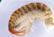
Misglen Quagga Quagga mussel